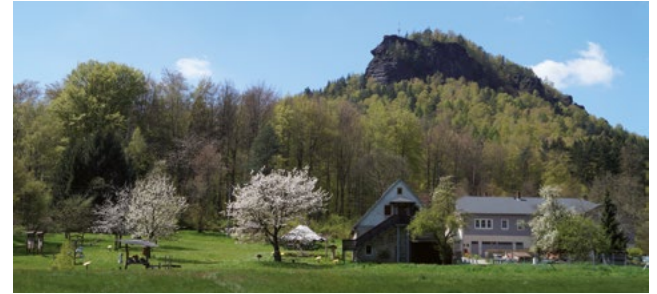
Kinder- und Jugendbildungsstätte Sellnitz der Nationalparkverwaltung Sächsische Schweiz (am Lilienstein, siehe Seite 23)